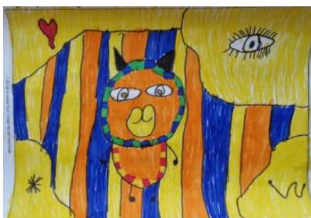
Emily G. groep 5