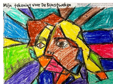
Chelsea groep 7