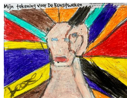
Jairo groep 7