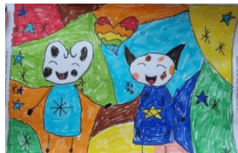
Amy groep 5